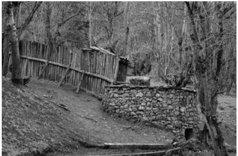
Chorco de los lobos.

No está claro el comienzo de la utilización de esta trampa para cazar lobos (también osos y jabalíes), posiblemente pase del medio milenio, pero lo cierto es que aún se conservan en los archivos del Real Concejo de Valdeón las primeras ordenanzas de montería fechadas en el año 1610, lo que nos sitúa este año en el 400 aniversario.