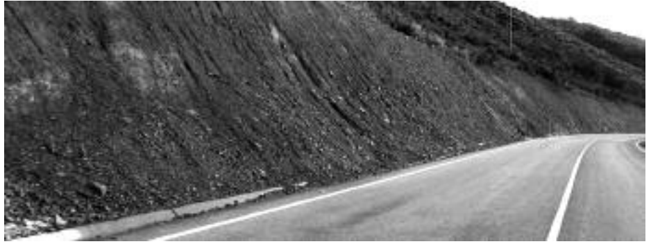
Carretera de Boca de Huérgano a Besande.

La caída de piedras sobre la cuneta y el firme, además de provocar una situación de riesgo en la circulación en la que la asociación montañesa pone el