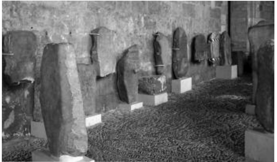
Estelas vadinienses en el museo de San Marcos.

—¡Bienvenido a casa, Vado, —Bienvenido a casa!