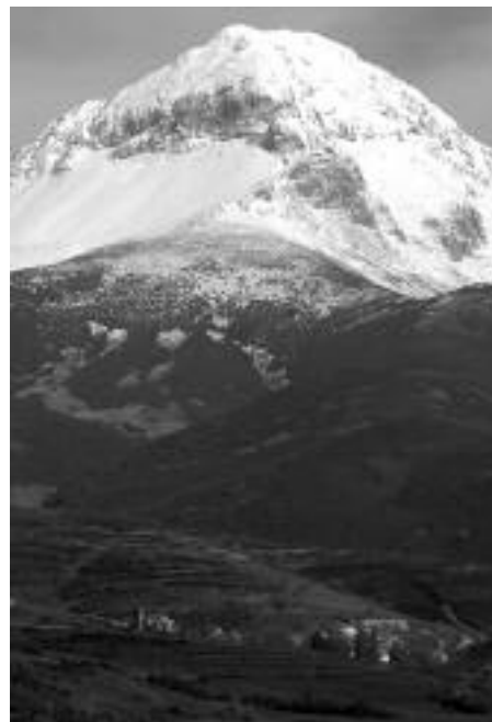
Espigüete, fronterizo con Palencia.

El principal cambio residió en dar la supremacía al capital productivo sobre el financiero. Las consecuencias más inmediatas de esta medida han sido, desde un punto de vista económico, una práctica de producción y consumo insostenibles. Políticamente el Capital ha quedado fuera de control de los parlamentos, no sin la connivencia de estos, se le ha dotado de un poder de intrusión en los Estados hasta ahora desconocido, y que le lleva al dominio, no ya sobre el conjunto de la sociedad y sus instituciones, sino sobre la misma naturaleza. Todo vale si es con el fin de producir. El Capital sólo admite ganancias, las pérdidas son subsanadas con dinero público. Sociológicamente estas políticas han supuesto un oleaje demográfico hacia los centros de producción y consumo que han supuesto la desertización humana de espacios que siempre supusieron la base de la subsistencia y por tanto iconos de la sostenibilidad.