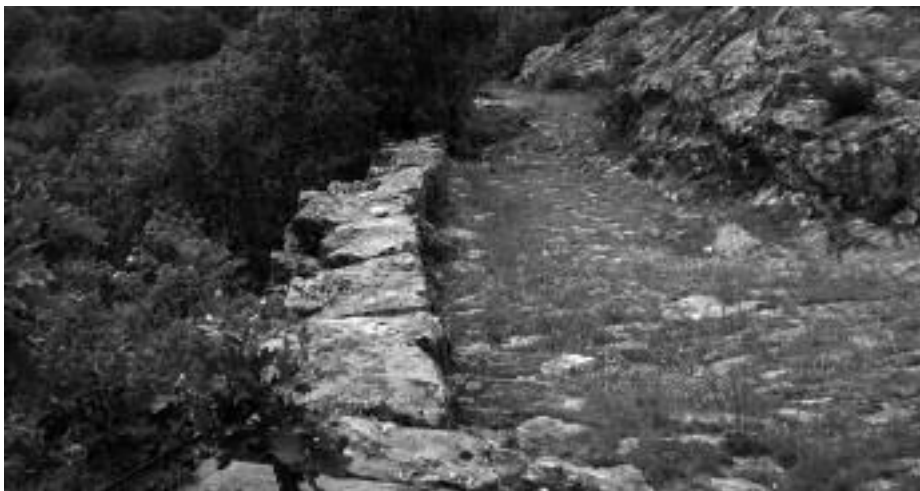
Tramo próximo a Villayandre y restaurado el pasado verano.

monio histórico y el natural. Las instituciones que deberían entender en esto siguen lejanas y sin querer saber nada. Su desgobierno y gusto por las pistas forestales unido al desconocimiento de lo publicado acerca de estos caminos, amenaza con la extinción total de los mismos en el área del Parque. Fuera del Parque, sólo Cistierna ha iniciado un proyecto de recuperación integral para caminos empedrados de gran antigüedad. Únicamente la educación y la sensibilidad de los montañeses hacia su patrimonio pueden evitar que en el futuro se produzcan hechos como el denunciado. En concreto para el tramo de las Salas-Remolina pedimos que se deshaga el desafuero cometido, y devuelva a su estado original. Terminemos con un frase de Don Marcelino Menéndez Pelayo que debería ser escrita con letras de oro en todos los Ayuntamientos y Casas de Concejo para que nuestros Alcaldes Concejiles y de Municipio no diesen las licencias de obras tan a la ligera y de consecuencias tan nefastas para el desarrollo sostenible, del que tantas veces hablan, sin tener idea de lo que ello implica: “DONDE NO SE CONSERVA PIADOSAMENTE LA HERENCIA DEL PASADO, POBRE Ó RICA, GRANDE O PEQUEÑA, NO ESPEREMOS QUE BROTE UN PENSAMIENTO ORIGINAL NI UNA IDEA DOMINADORA”.