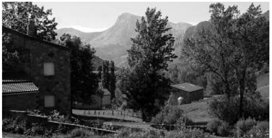
Rincón de Polvoredó (Archivo).

Hace dos años, en la Nochevieja de 2007, se nos ocurrió a un grupo de no más de once personas salir a felicitarnos el nuevo año delante del SALÓN DE LOS MOZOS. ➔