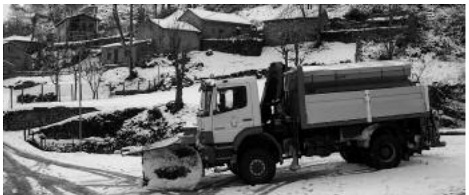
Quitanieves en Caín.

En la vega de Boyán, junto al embalse de Los Llanos, Tragsa ejecuta la adecuación de un área recreativa también encargada por el parque nacional, que se espera pueda estar en uso para el verano.