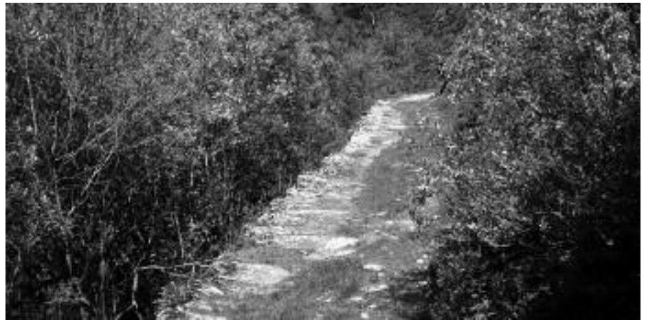
Tramo de San Roque en las Salas.

Martino y Siro, se preguntan si no existía otra alternativa para la traída de agua, sobre todo cuando antes se les había encargado supervisar los trabajos de restauración y documentación del