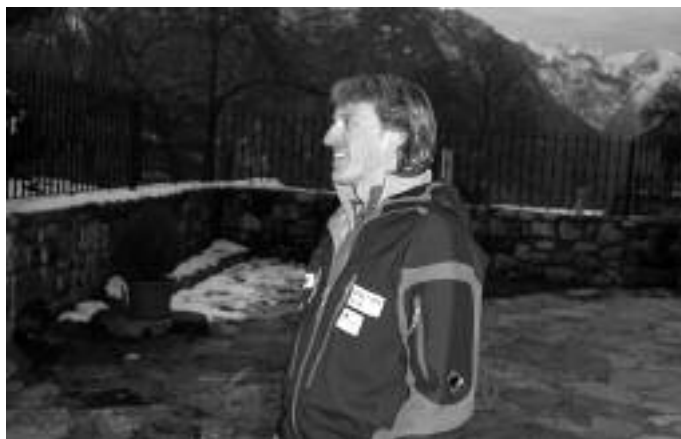
Jesús Calleja en Sajambre.

En la foto, Jesús Calleja durante su visita a Oseja de Sajambre el pasado mes de Febrero, visita en la que fue recibido por la Asociación de Turismo Rural de Sajambre.