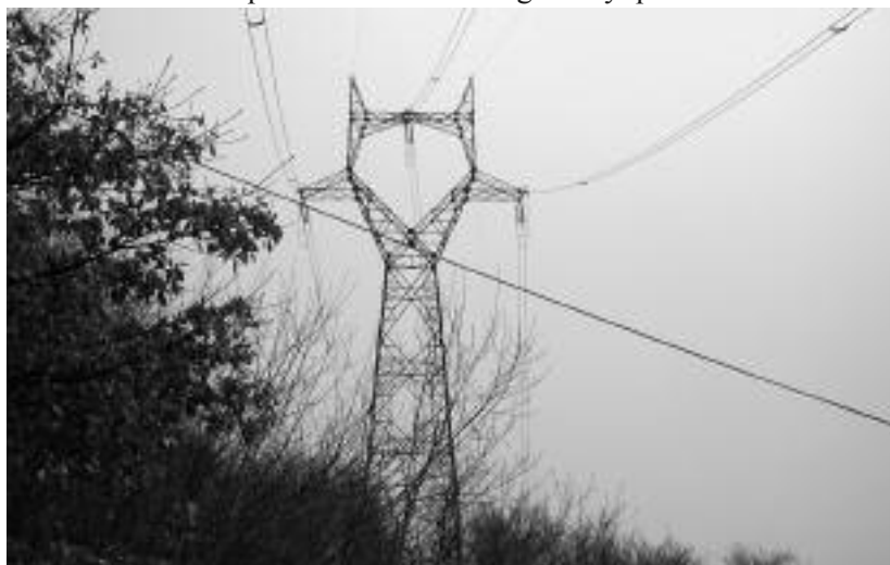
Líneas de alta tensión por el monte.

Conocemos muchos casos en que la historia se manipula, se traslada y se reinscribe a petición de aquellos que guardan intereses ocultos, como ejemplos podemos ver el British Museum, pues en su interior guarda los tesoros más hermosos de la cultura egipcia, o también, sin irnos muy lejos, si buscamos los libros de nuestros padres y abuelos, bien claro nos describe quien es el malo en la guerra y quien son los buenos.