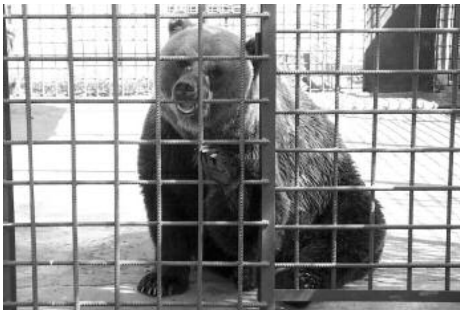
Oso del coto escolar.

Las bendiciones comenzaron a agolparse: coste razonable, herramienta de sensibilización ambiental clara (una de las obligaciones del parque regional), aplauso de alcaldes y hosteleros, algún puesto de trabajo, la ilusión de los escasos rapaces que nos quedan... Demasiado bonito, casi no parecía la Comarca en pleno azote demográfico. Por eso, por nuestro bien y tras un dubitativo plácer, el responsable administrativo del asunto salió rápidamente a la palestra para de-