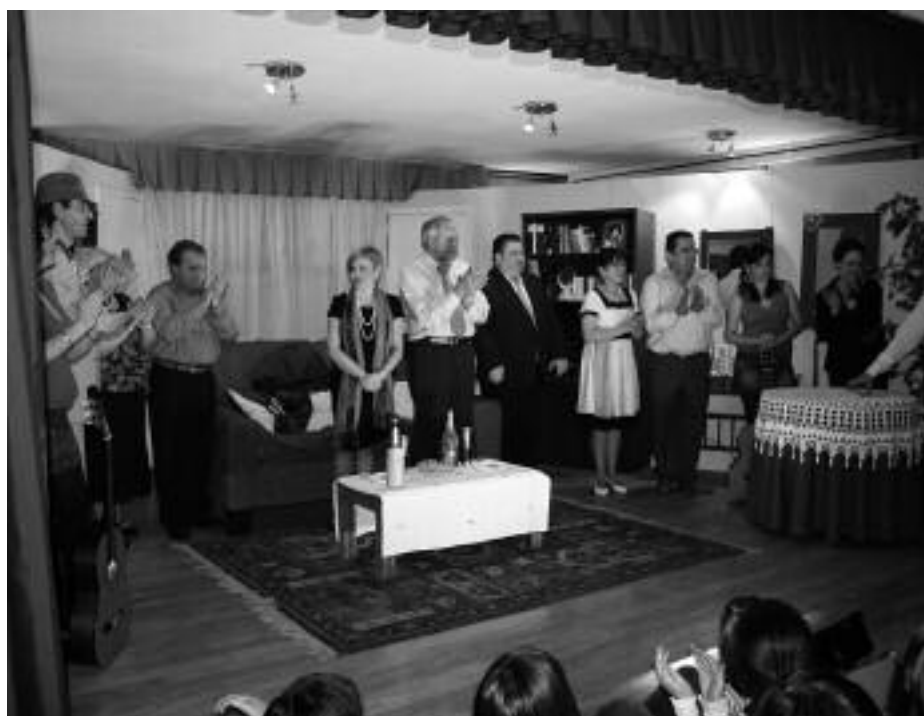
Un momento de la obra de teatro.