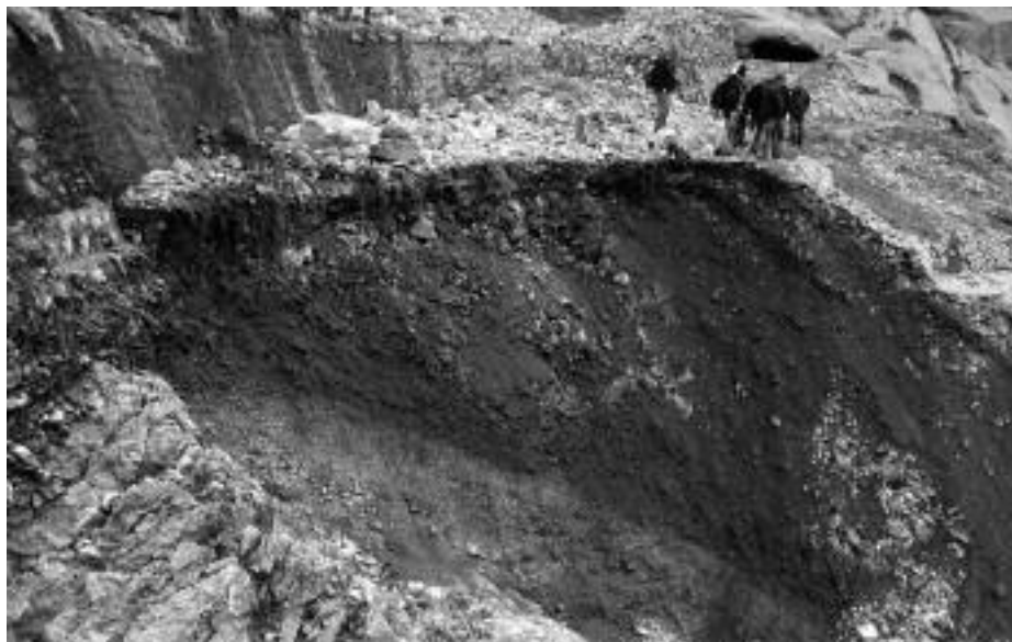
Desprendimiento en la Ruta del Cares.

En pocos días se habilitó un paso provisional asegurado con cables pasamanos y balizas, pero las obras definitivas serán bastante más complejas de ejecutar, dado lo remoto del lugar y la dificultad de acceso, que impone el transporte con helicóptero de maquinaria y materiales. Además, la magnitud del derrumbe supone también un detenido estudio del terreno en previsión de nuevos movimientos de tierras o desprendimiento de grandes piedras,